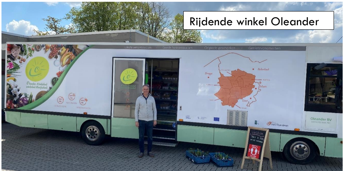
Rijdende winkel Oleander