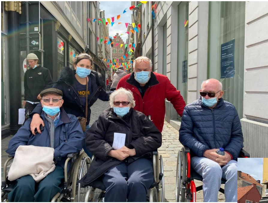
Uitstap naar Gent met de tram